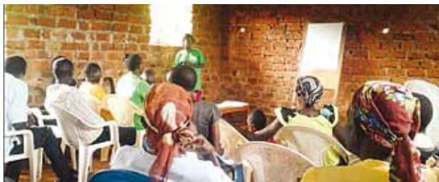
Elinkeinojen kehittämishankkeen koulutus meneillään Keniassa.

Asiasta päätetään eduskunnan täysistunnossa.